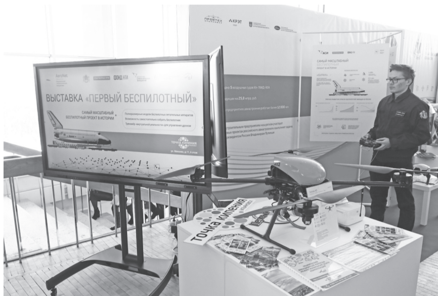
Первые дроны ульяновского производства официально были продемонстрированы широкой публике 19 января этого года на выставке, приуроченной к 80-летию Ульяновской области.

Остается добавить, что неделю назад на крупнейшем промышленном форуме России «Иннопром-2023»